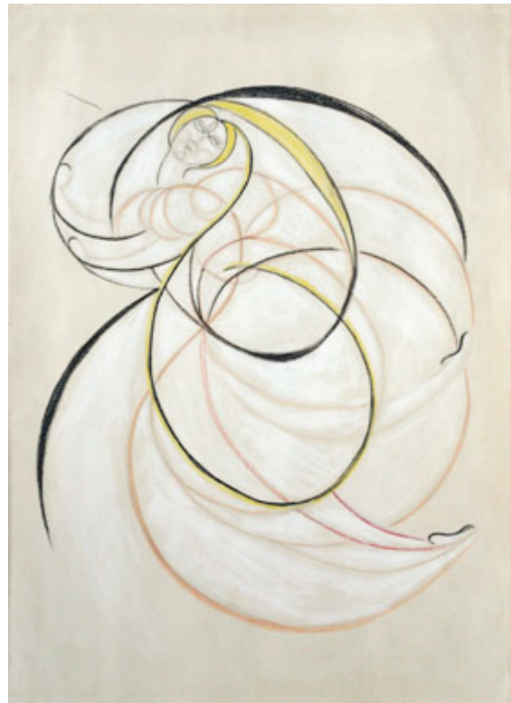
Vaslav Nijinsky. Die Tänzerin, o.J. Bleistift und Buntstift auf Papier, 35 x 25 cm.