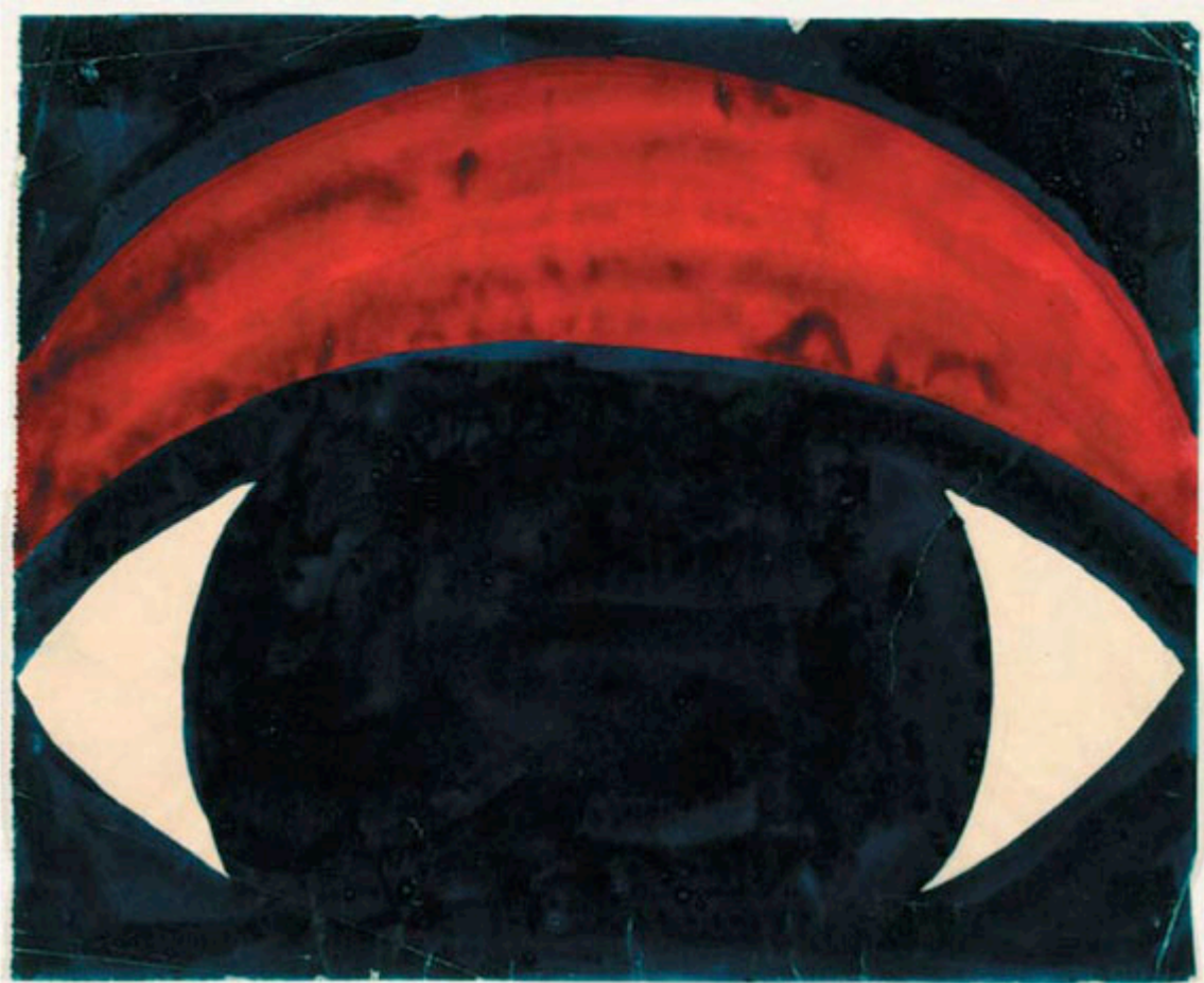
Vaslav Nijinsky. Aus der Serie Auge, 1918/1919. Pastell, 20 x 25 cm.